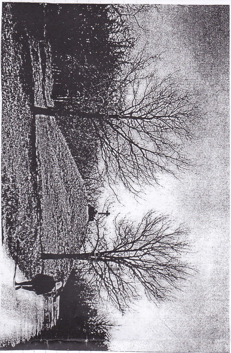
La croix - Mathieu.